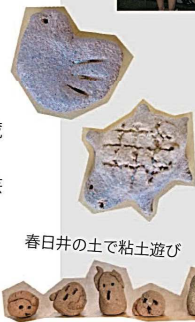
春日井の土で粘土遊び