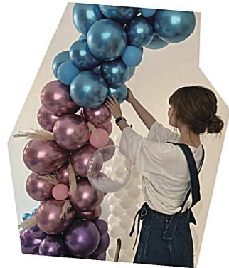
アート & アソブ

バルーンアート体験 体験料 500円 11時 12時 13時 14時開催 各回 4組まで