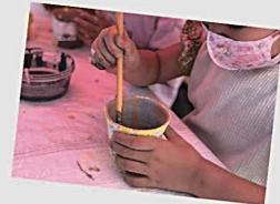
前回のツクル、やきもの絵付け